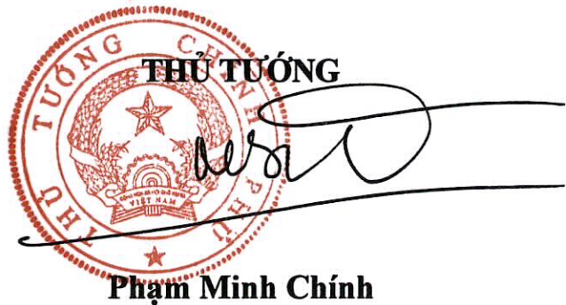
Phạm Minh Chính